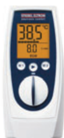
FB 1 SL