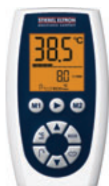
FFB 2 SL