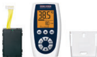
FFB 1 SL