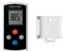
Pilot zdalnego sterowania