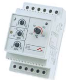
Termostat Devireg™ 316